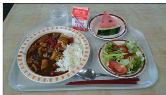
※写真は今年のメニューです